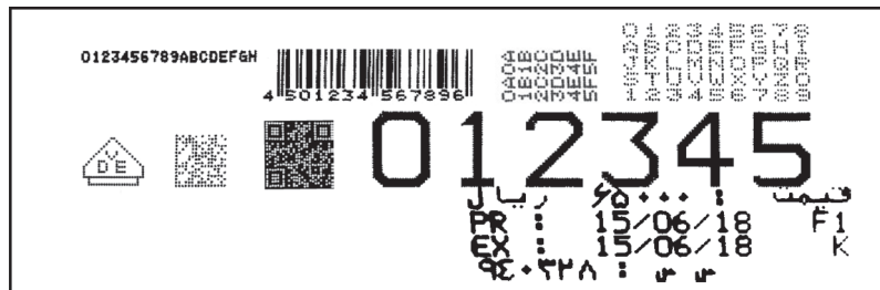
نمونه چاپ استاندارد

بی همتا در کارایی، بی رقیب در امکانات کمپانی هیتاچی نسل جدیدی از جت پرینترهای صنعتی را روانه بازار داشته که تغییرات شگفتی در کارایی به خود دیده است. به طوری که نیاز به خدمات و نگهداری در این محصول جدید به شدت کاهش یافته و امکانات زیادی به آن اضافه شده است. این جت پرینتر علاوه بر چاپ کارکترهای ریز، می‌تواند به عنوان یک جت پرینتر درشت نگار نیز به کار رود به طوری که امکان چاپ کارکترهایی از کمتر از ۲ میلیمتر تا بیش از ۴۵ میلیمتر را بسته به فاصله هد از محصول مهیا می‌سازد. سرعت بالای جت پرینترهای هیتاچی امکان استفاده در خطوط تولید با سرعت تا ۵ متر بر ثانیه را مهیا کرده است. سری UX به عنوان نسل جدید جت پرینتر جهت اتصال به شبکه سازگار شده است، در نتیجه شرکت‌هایی که می‌خواهند جت پرینترهای خود را از راه دور و یا